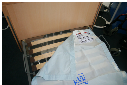
De Rescuesheet wordt tussen de bedbodem en het matras geplaatst.