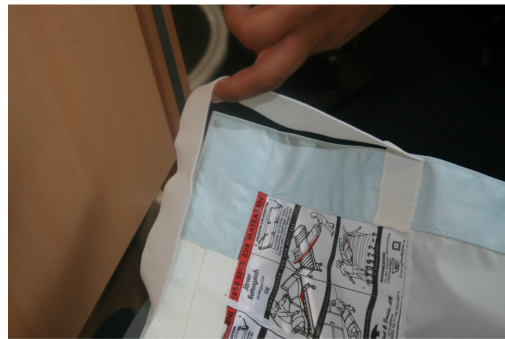
Bevestig de hoek lussen over het matras