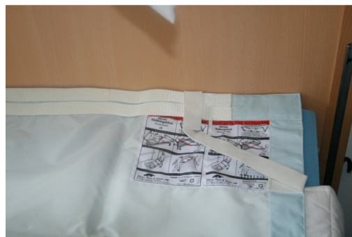
Het etiket wordt altijd geplaatst bij het hoofdeinde van het bed.