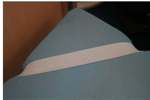
Alle vier de hoeken dienen voorzien te zijn van een elastische hoekband