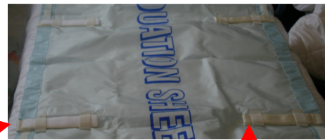
Zorg er voor dat de fixatiebanden altijd makkelijk bereikbaar zijn.