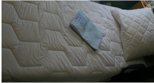
De Rescuesheet dient opgevouwen te worden

De Rescuesheet opmaak van de bedden dient te gebeuren volgens de hieronder vermelde methoden.